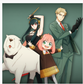
SPY X FAMILY Chloé Metz