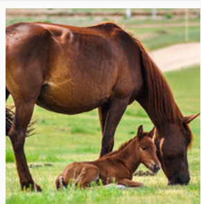
Les Chevaux Lou Paulino