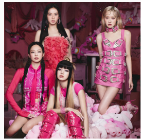
Blackpink Chemsî Tranzer